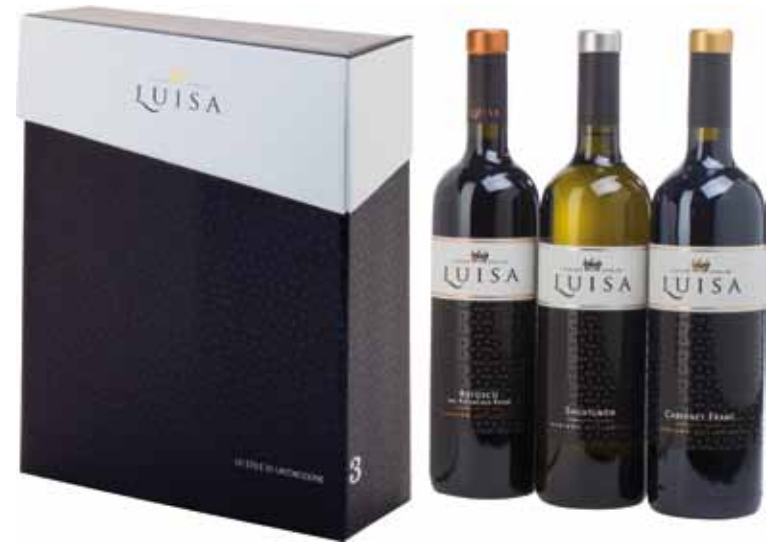
Geschenkpakung für 1, 2 und 3 Flaschen